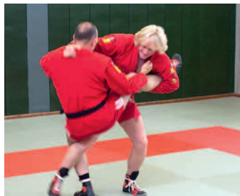
Kragengriff, Innensichel, rechts. Fuß fixieren.