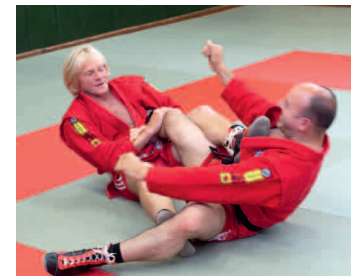
Linkes Bein hindert den Gegner am aufrichten.