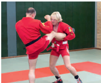
Grader Fußstoß vom Gegner abfangen.