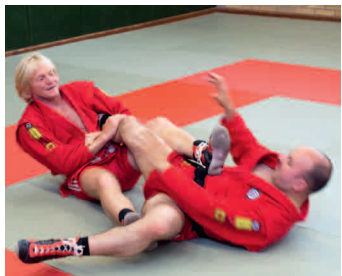
Gegner bewegt sich aus Achillessehnen-Hebel durch Drehung auf den Bauch.