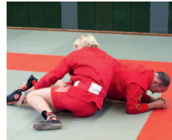
Gegner in Bauchlage zwingen und belasten.