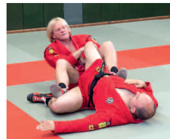
In die Rückenlage fallen. Fuß und Bein weiter fixieren. Hohlkreuz, Körperbewegung nach hinten. Achillessehnen hebeln.